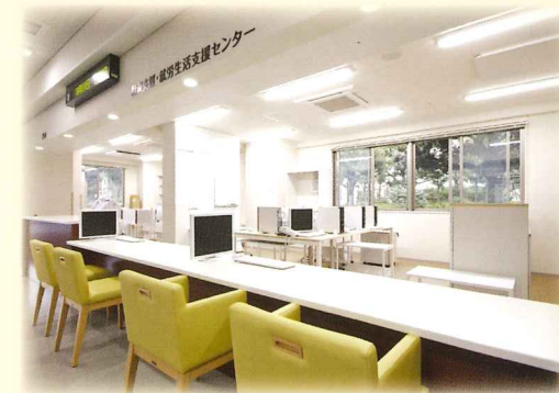
相談支援/就労生活支援センター

障害棟にはパン工房や菜園、喫茶室があり、障害部門のご利用者がつくったパンや野菜が喫茶室で販売されています。