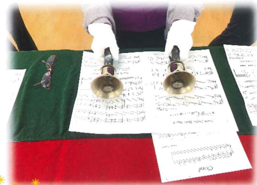
昨年11月15日ハンドベル演奏会の様子です。素敵な音色を楽しみ演奏の体験もできました。

は～とふるでは東大和市の委託を受けて、高齢者や障害のある方の介護やケアをしている方（ケアラー）の支援を行っています。昨年度は毎月第4木曜日の「ケアラズカフェほのぼの」は延べ62名、奇数月の第三金曜日の障害のある方のケアをされている方向けの交流会は延べ67名ご参加いただきました。その他講演会も2回、60名のご参加がありました。各回の内容は市報やチラシでご案内しています。